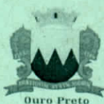
Vereador Chiquinho de Assis - PV