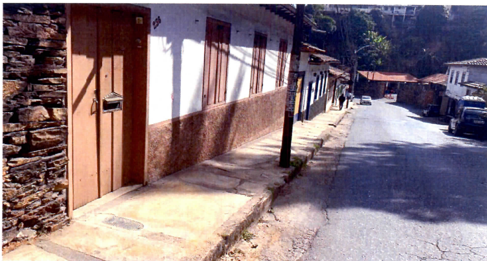
Imagem 03: Piso reconstituído após instalação de hidrômetro