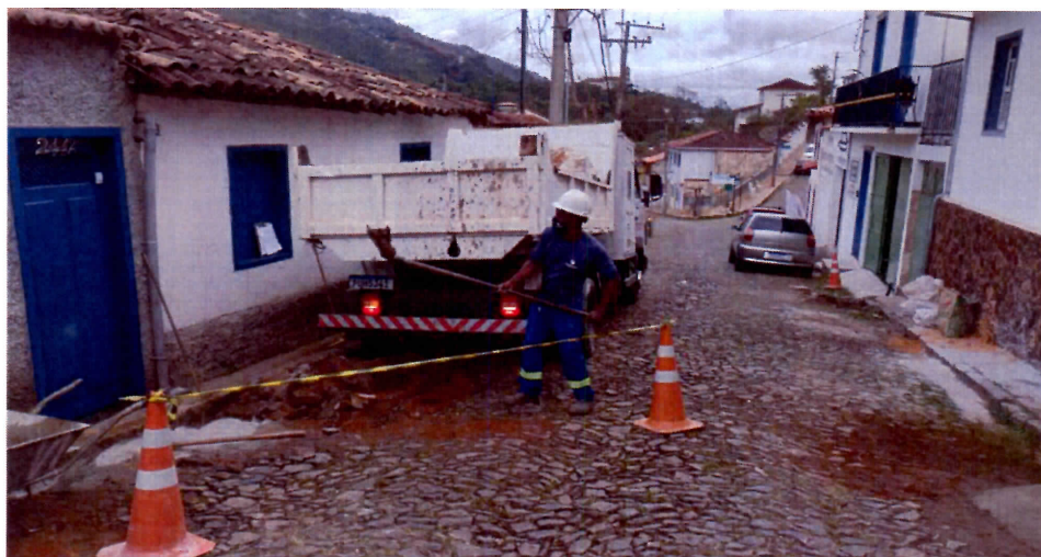
Imagem 01: Remoção de resíduos gerados na instalação dos hidrômetros