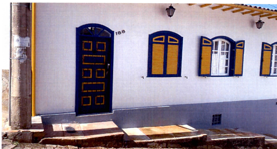
Imagem 04: Piso reconstituído após instalação de hidrômetro

Nada mais havendo a se tratar, me despeço e me coloco à disposição para qualquer esclarecimento que se fizer necessário.