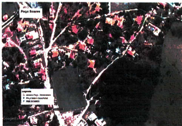
Figura 01: Imagem do Google Earth com localização pretendida para perfuração do Poço Soares.

A título de informação, a área necessária para perfuração do poço e instalação das infraestruturas necessárias para seu acionamento é de 100m 2 (cem metros quadrados)