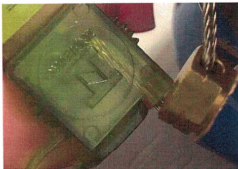
Imagem 01: hidrômetro com certificação do INMETRO no lacre de segurança

Segue, para conhecimento, foto de um hidrômetro, antes da instalação, comprovando o selo de qualidade fornecido pelo INMETRO, Imagens 01 e 02, a seguir: