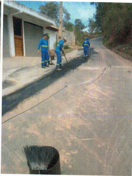
RECOMPOSIÇÃO ASFÁLTICA, RUA SANTO AMARO, 73, AMARANTINA, PROTOCOLO 2731000 (08/08/2022)