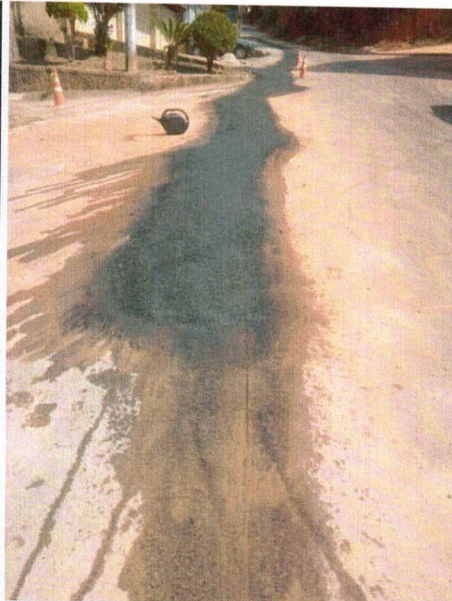
RECOMPOSIÇÃO ASFÁLTICA, RUA SANTO AMARO, 73, AMARANTINA, PROTOCOLO 2731000 (08/08/2022)

Nada mais havendo a tratar, me despeço e me coloco à disposição para qualquer esclarecimento que se fizer necessário.