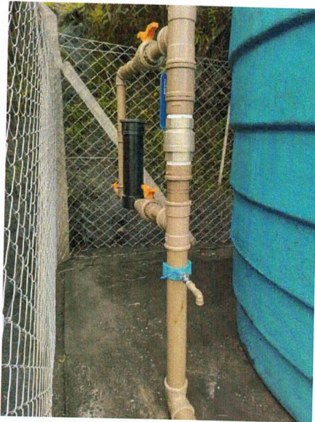
SISTEMA DE DESINFECÇÃO, NOVO RESERVATÓRIO SARAMENHA (10/10/2022)