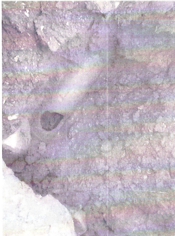
REPARO DE REDE DE ESGOTO, RUA DOM VELOSO, Nº 140, DISTRITO DE SANTA RITA, PROTOCOLO Nº 2844571 (03/03/2023)