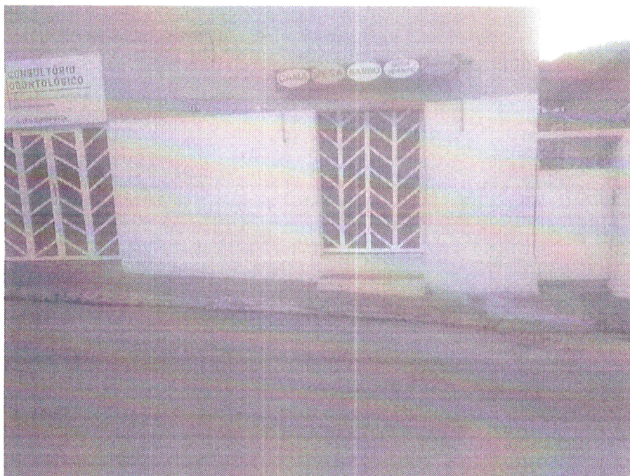
REPARO DE REDE DE ESGOTO, RUA DOM VELOSO, Nº 140, DISTRITO DE SANTA RITA, PROTOCOLO Nº 2844571 (03/03/2023)