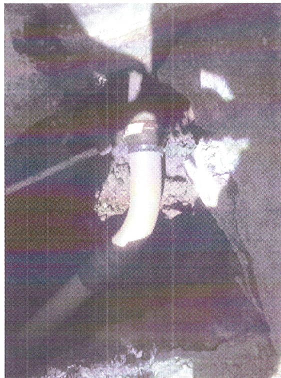
REPARO DE REDE DE ESGOTO, RUA DOM VELOSO, Nº 140, DISTRITO DE SANTA RITA, PROTOCOLO Nº 2844571 (03/03/2023)