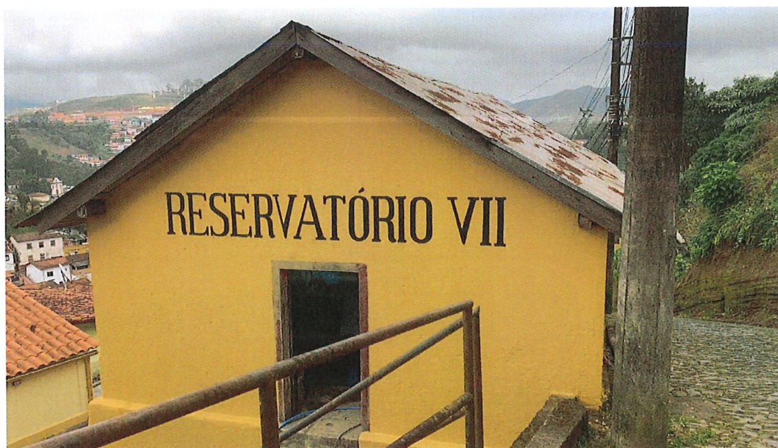
FRENTE RESERVATÓRIO CAIXA VII (DEPOIS REFORMA/PINTURA – JUNHO/2023)