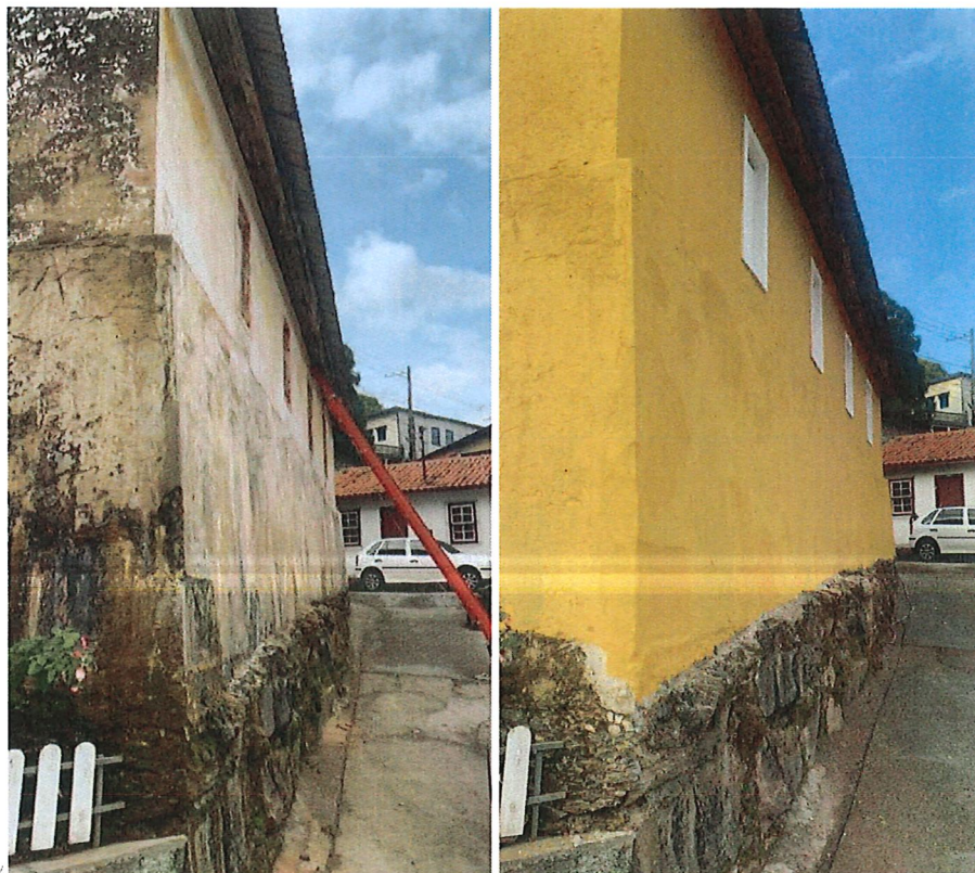
COMPARATIVO LATERAL RESERVATÓRIO CAIXA VII (ANTES / DEPOIS DA REFORMA)