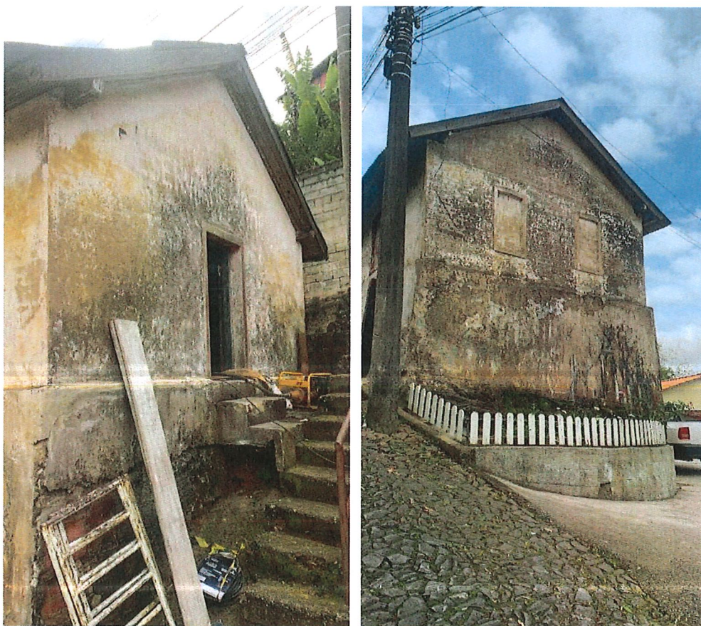
LATERAIS EXTERNAS, RESERVATÓRIO CAIXA VII (ANTES DA REFORMA)