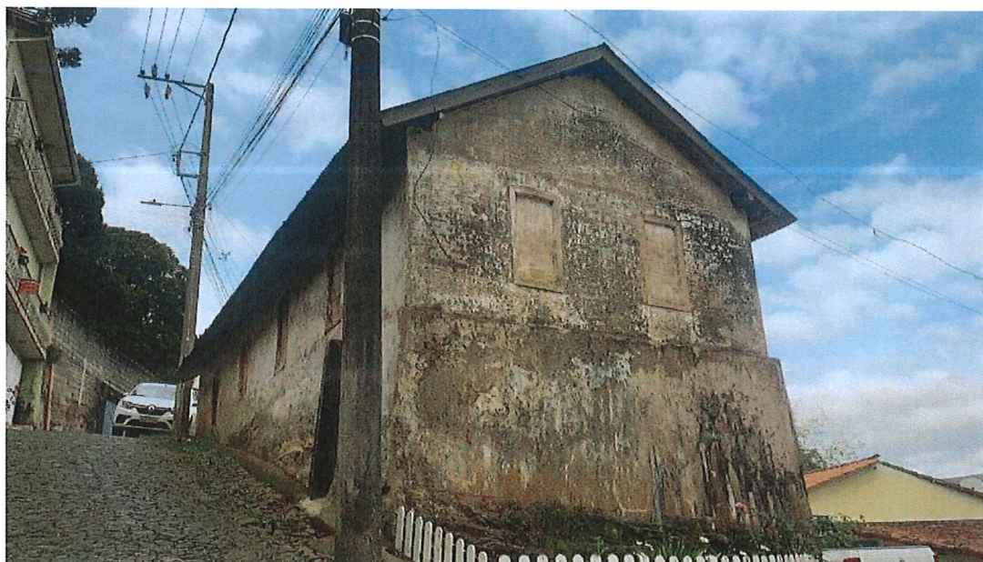
LATERAIS EXTERNAS, RESERVATÓRIO CAIXA VII (ANTES DA REFORMA)