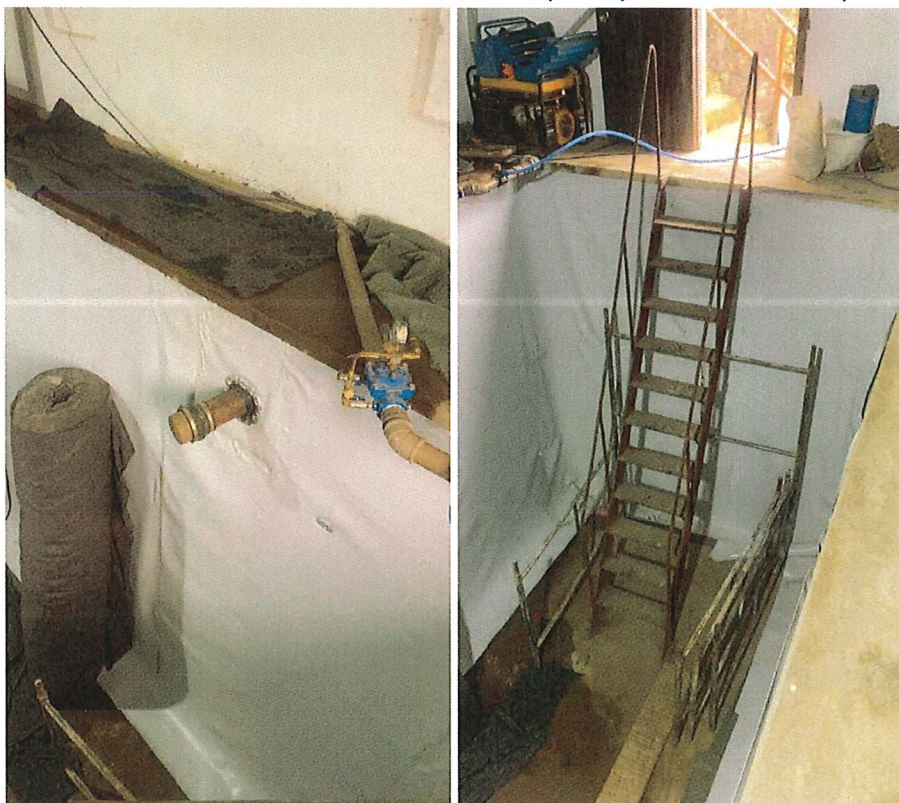
IMPERMEABILIZAÇÃO ÁREA INTERNA, RESERVATÓRIO CAIXA VII (JUNHO/2023)