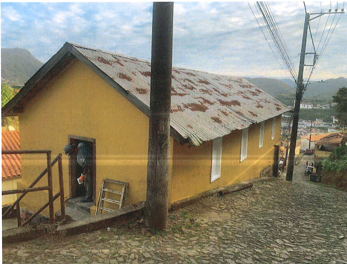
FRENTE E LATERAL EXTERNAS, RESERVATÓRIO CAIXA VII (DEPOIS REFORMA/PINTURA – JUNHO/2023)