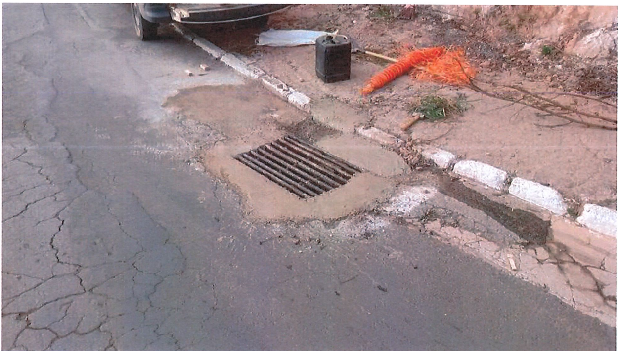
REPARO TAMPA DE LOBO, ESTRADA DO BANDEIRA, SANTA RITA