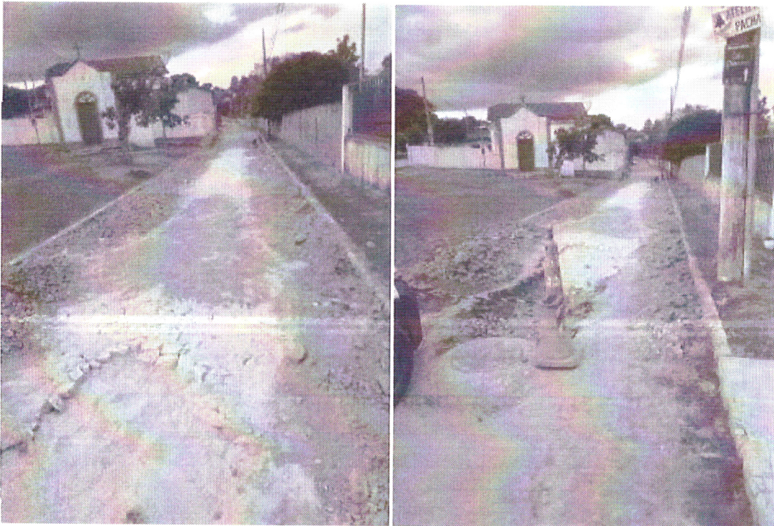
RECOMPOSIÇÃO CALÇAMENTO, RUA ANTÔNIO DOS SANTOS, DISTRITO DE SANTO ANTÔNIO DO LEITE (08/2023)