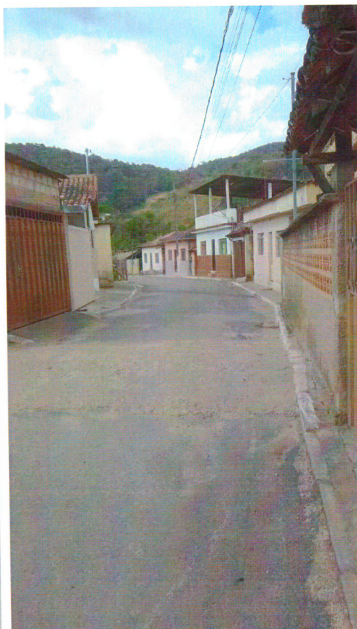
VISTORIA REDE DE ESGOTO, TRAVESSA DO ENGENHO, SANTA RITA (04/10/2023)