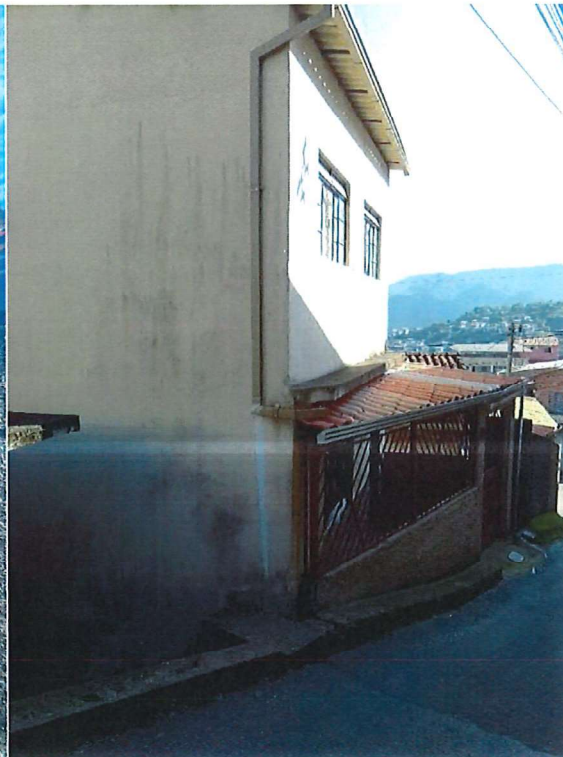
VISTORIA IMÓVEL SITUADO ENTRE CRUZAMENTO DAS RUAS JOSÉ ANASTÁCIO E DA ABOLIÇÃO, Nº 367, BAIRRO PIEDADE