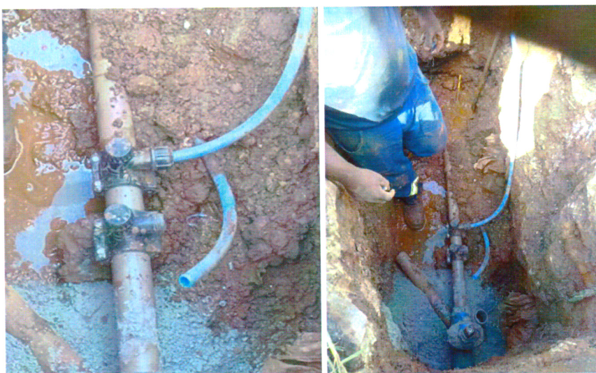
REPARO REDE DE ABASTECIMENTO, RUA SANTA RITA, BAIRRO N. SRA. DO CARMO, PROTOCOLO Nº 3026805.