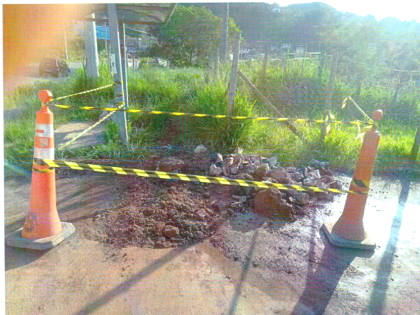
REPARO REDE DE ABASTECIMENTO, RUA SANTA RITA, BAIRRO N. SRA. DO CARMO, PROTOCOLO Nº 3026805.