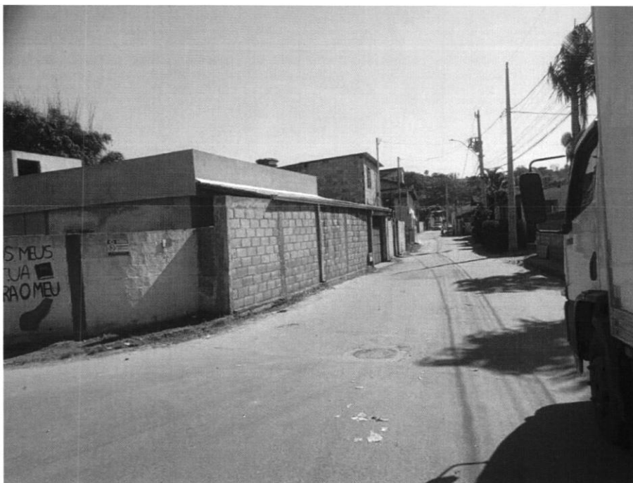
VISTORIA RUA FRANCISCO COELHO, AMARANTINA (15/05/2024)