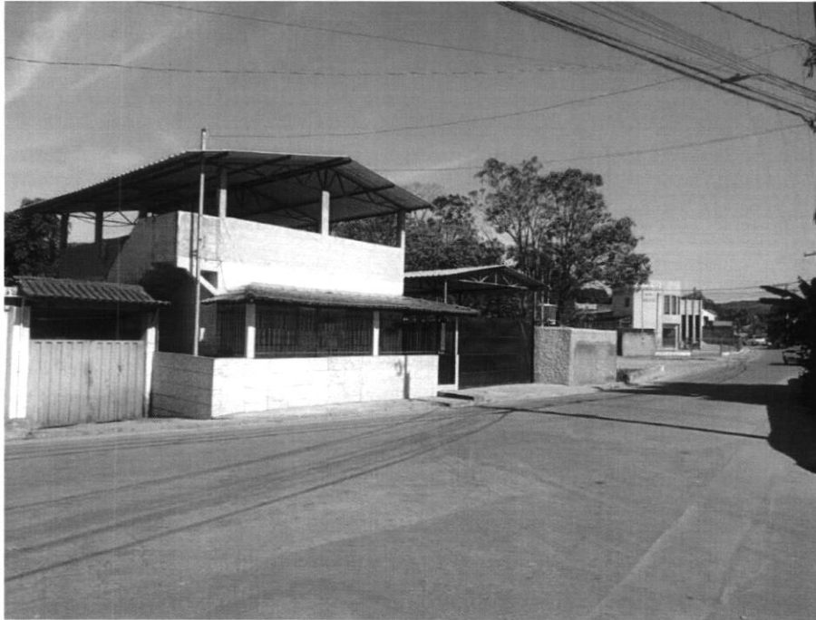
VISTORIA RUA FRANCISCO COELHO, AMARANTINA (15/05/2024)