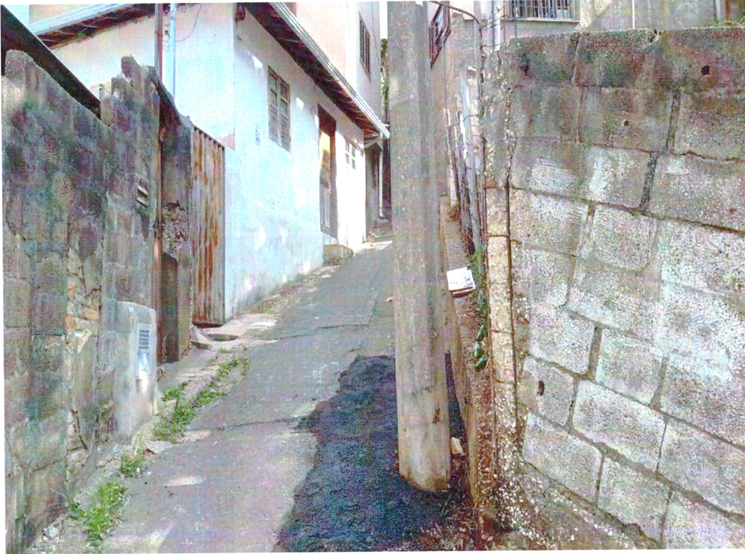
REPARO DE CALÇAMENTO, RUA PLATINA, SÃO CRISTÓVÃO.