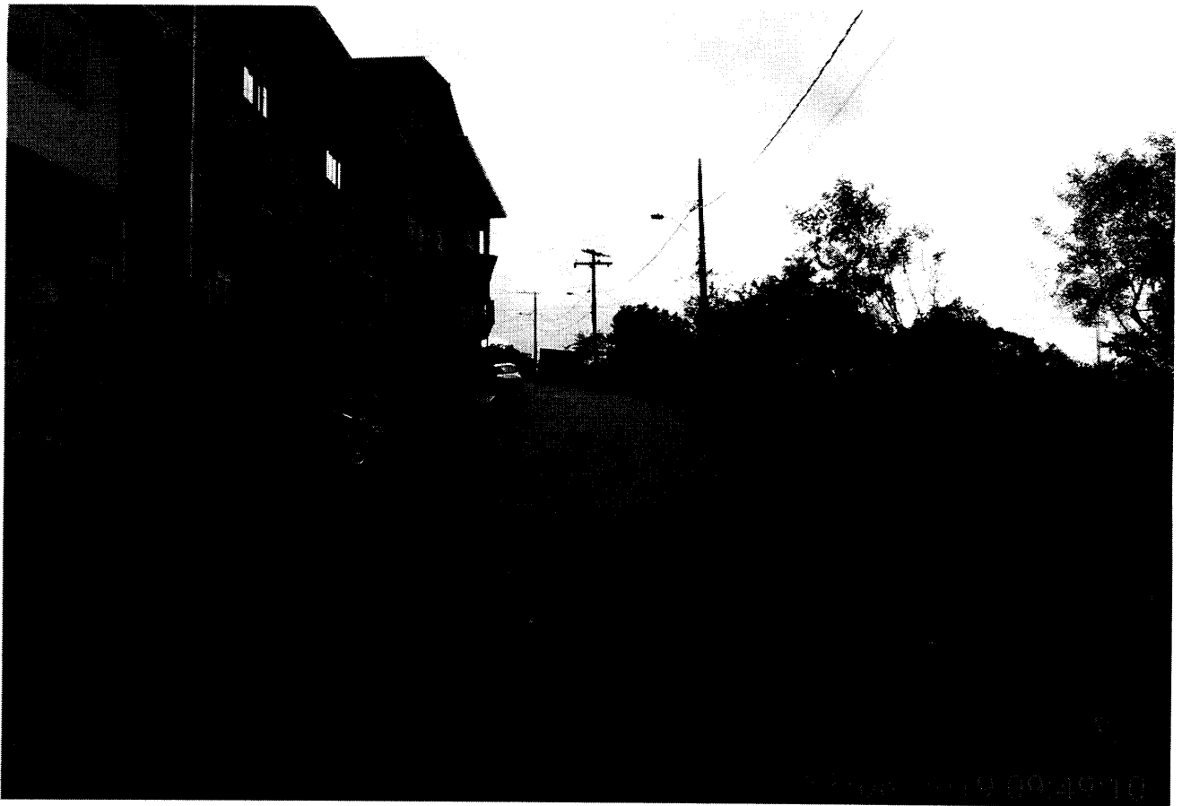
Frente do terreno