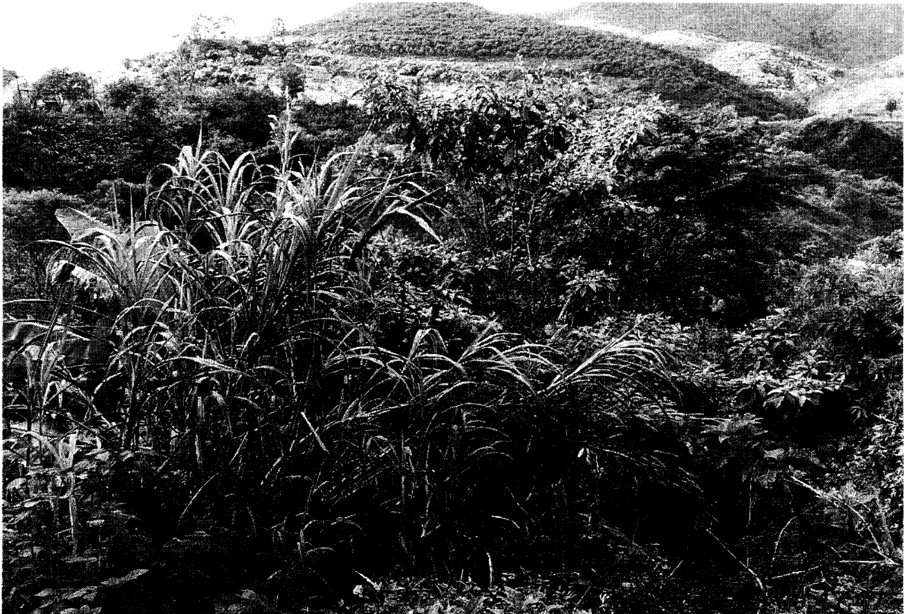
Fundos do terreno