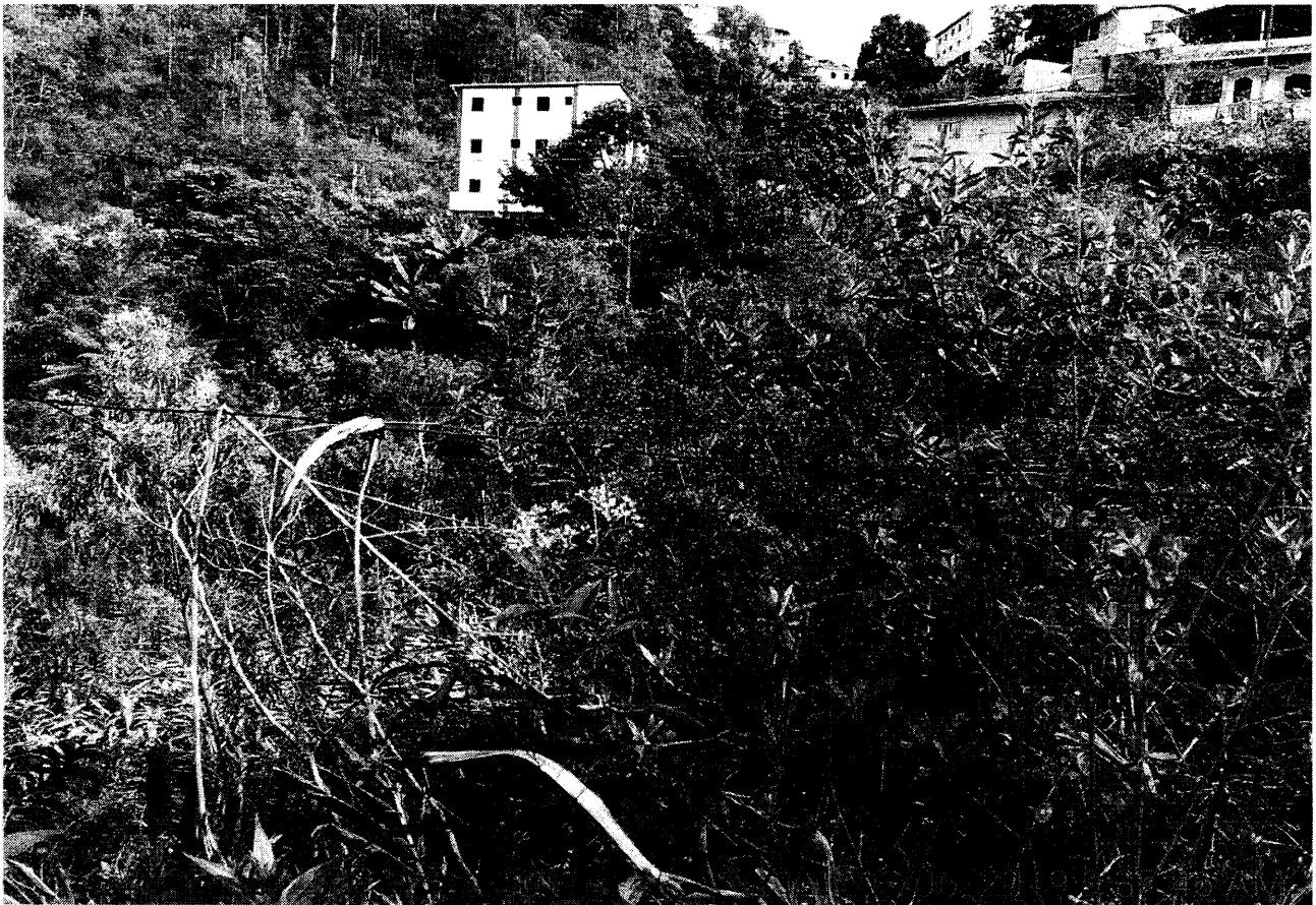
Fundos do terreno