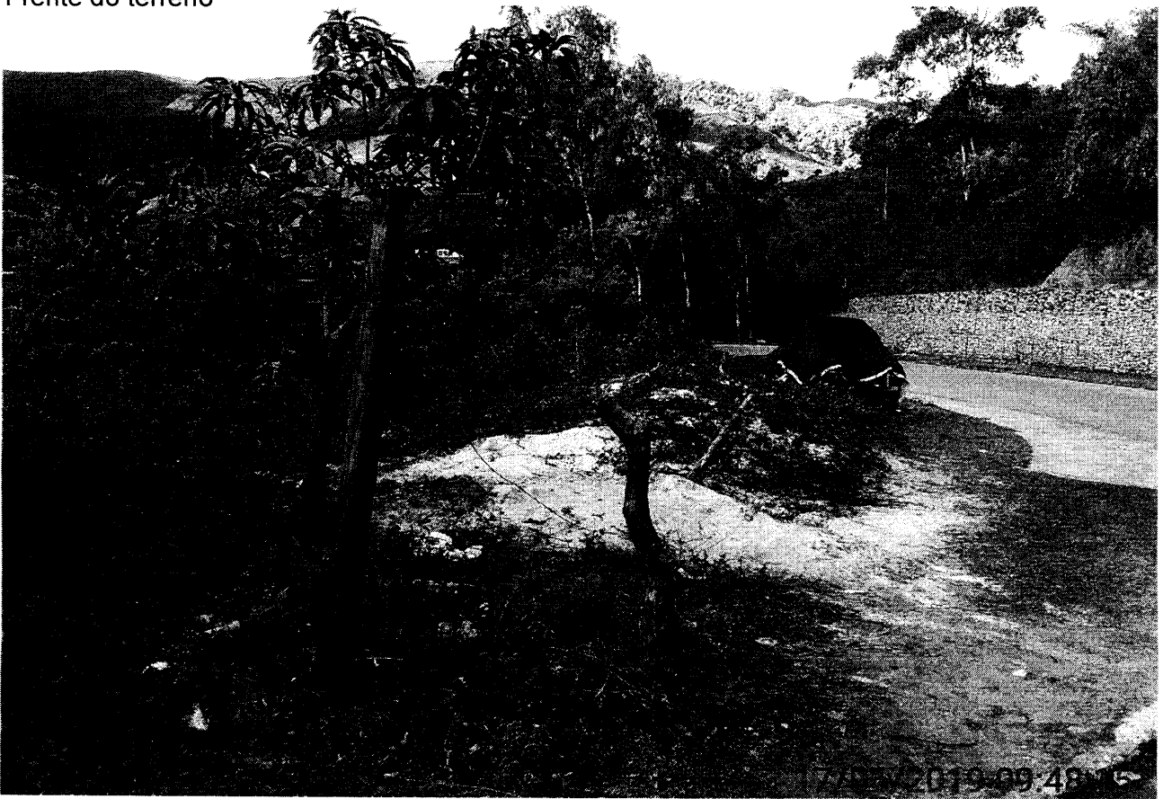
Frente do terreno