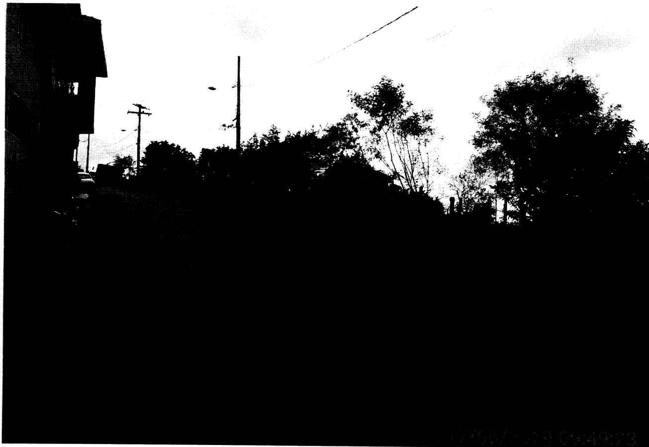
Frente do terreno