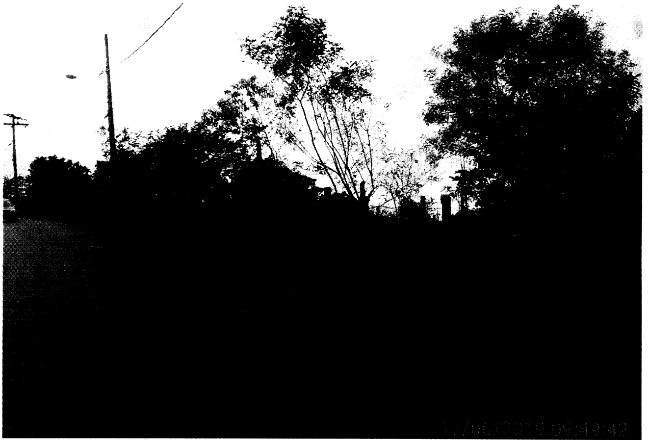
Frente do terreno