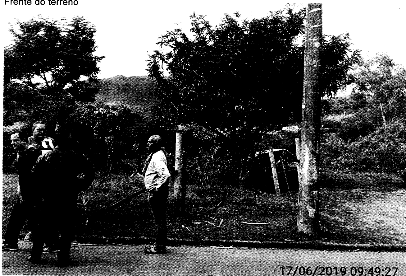
Frente do terreno