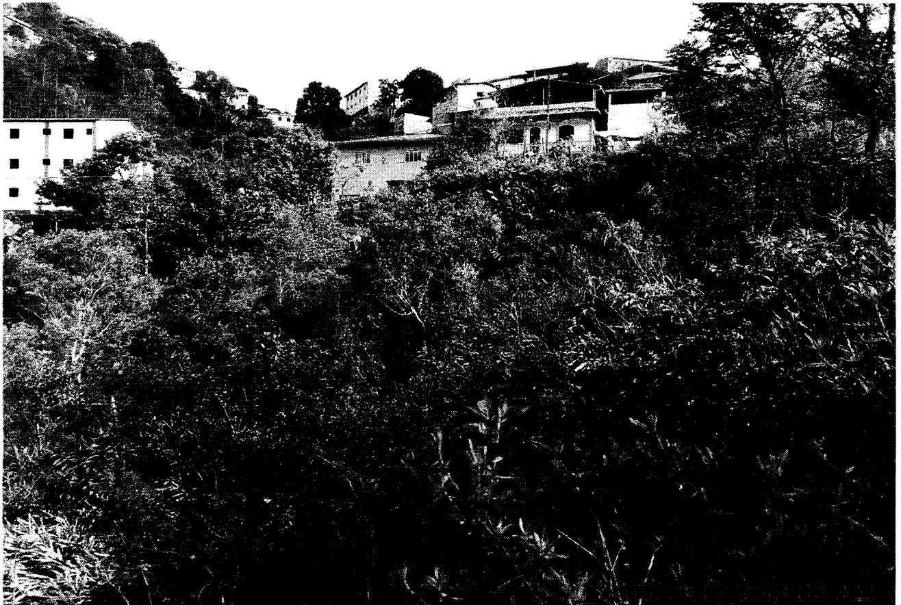
Fundos do terreno