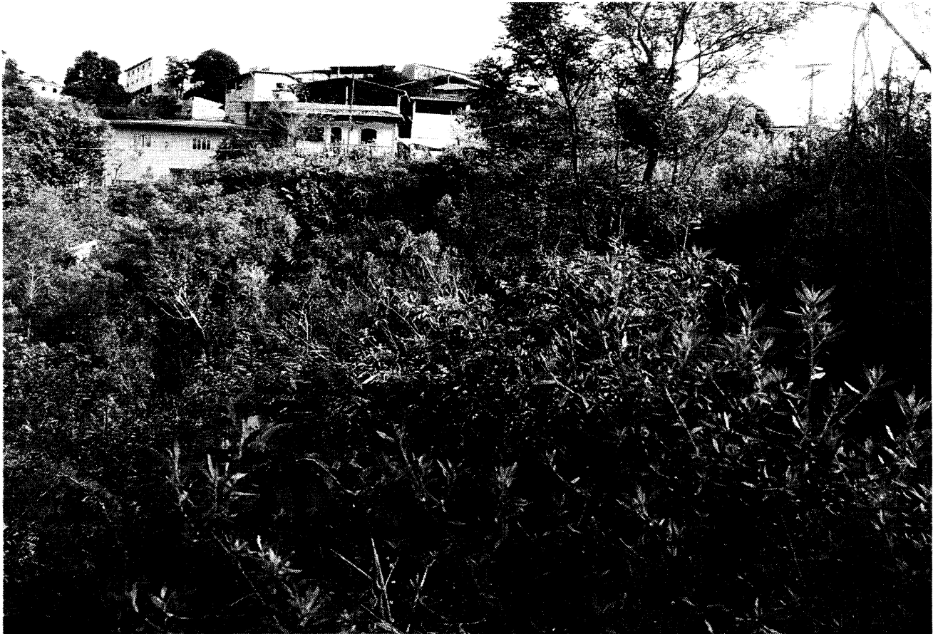
Fundos do terreno