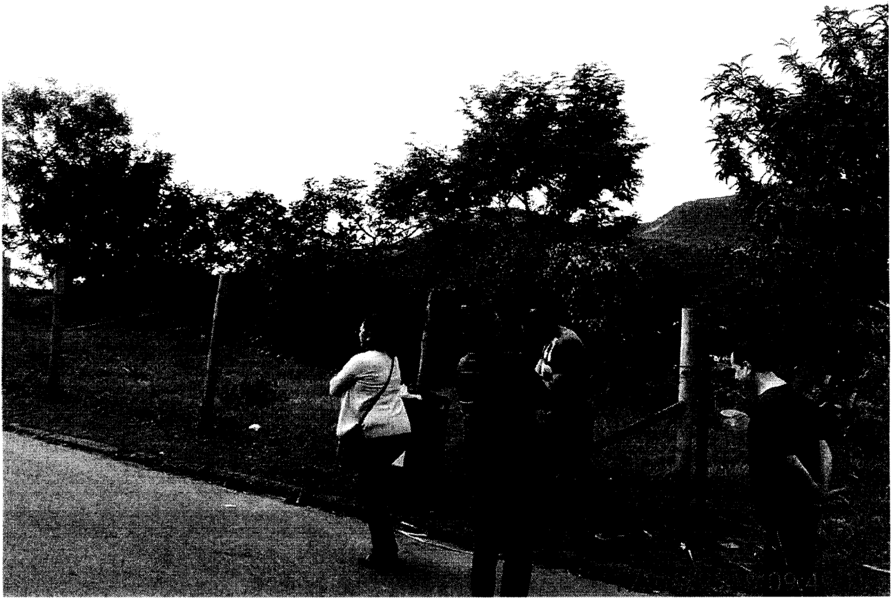
Frente do terreno