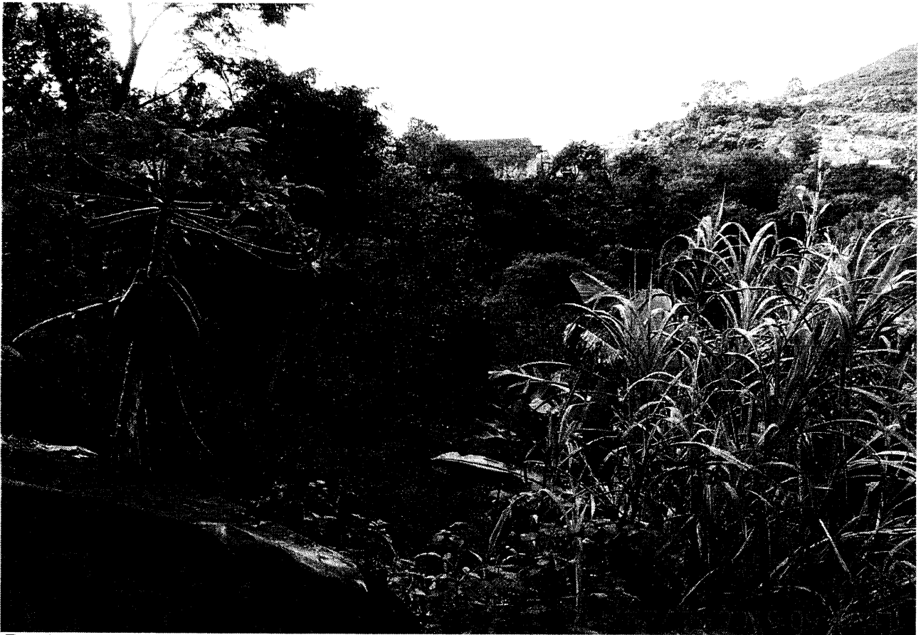
Fundos do terreno