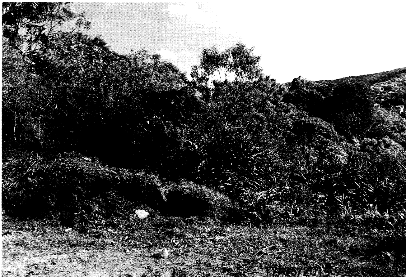
Fundos do terreno