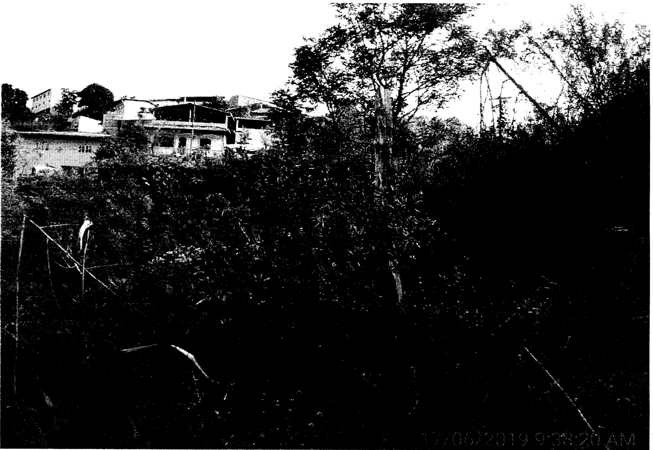
Fundos do terreno