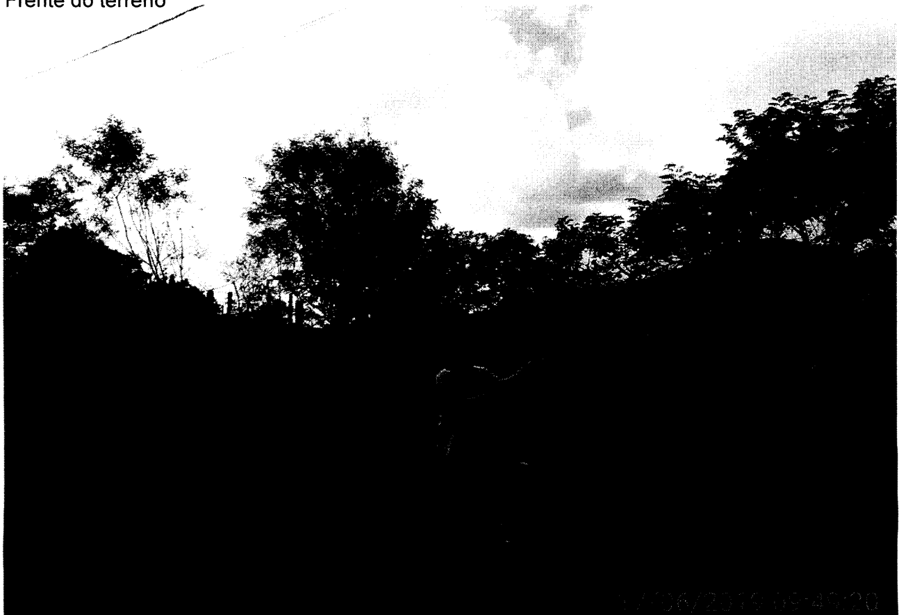
Frente do terreno