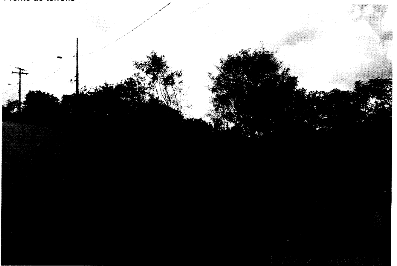
Frente do terreno