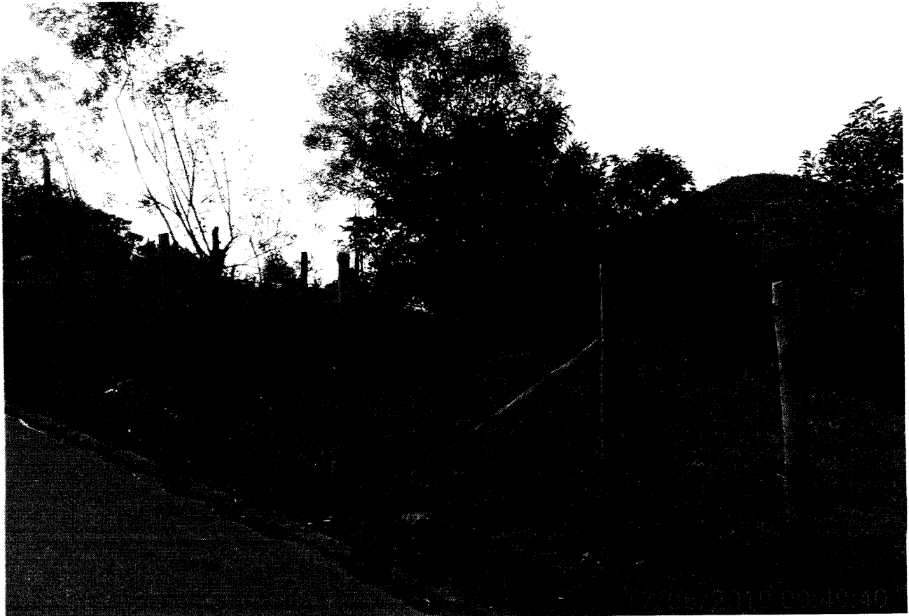
Frente do terreno