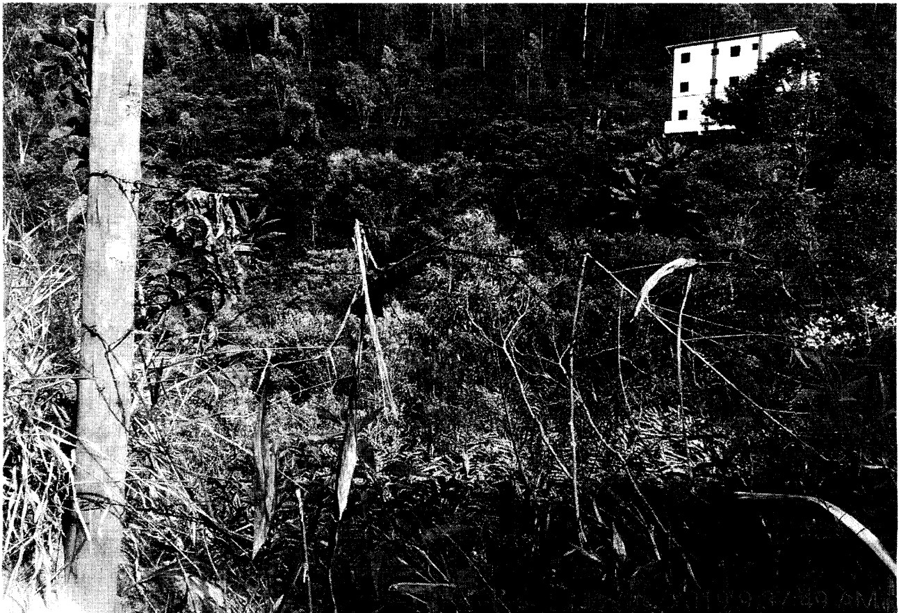
Fundos do terreno