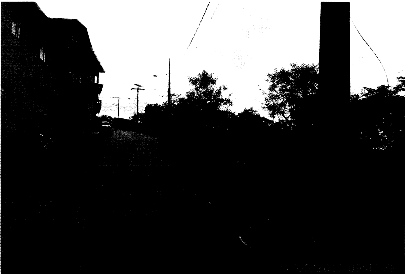
Frente do terreno