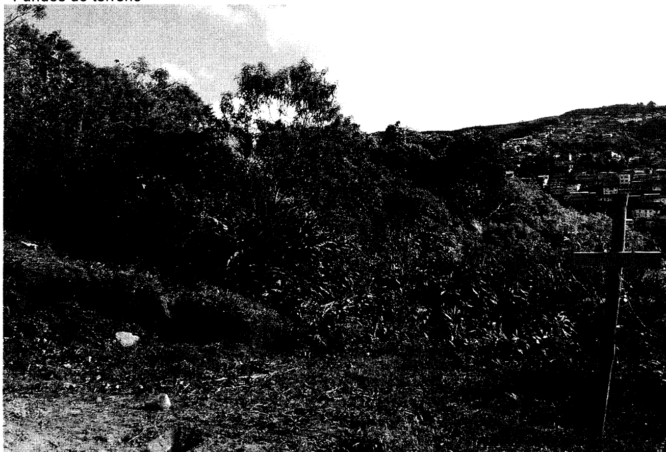
Fundos do terreno