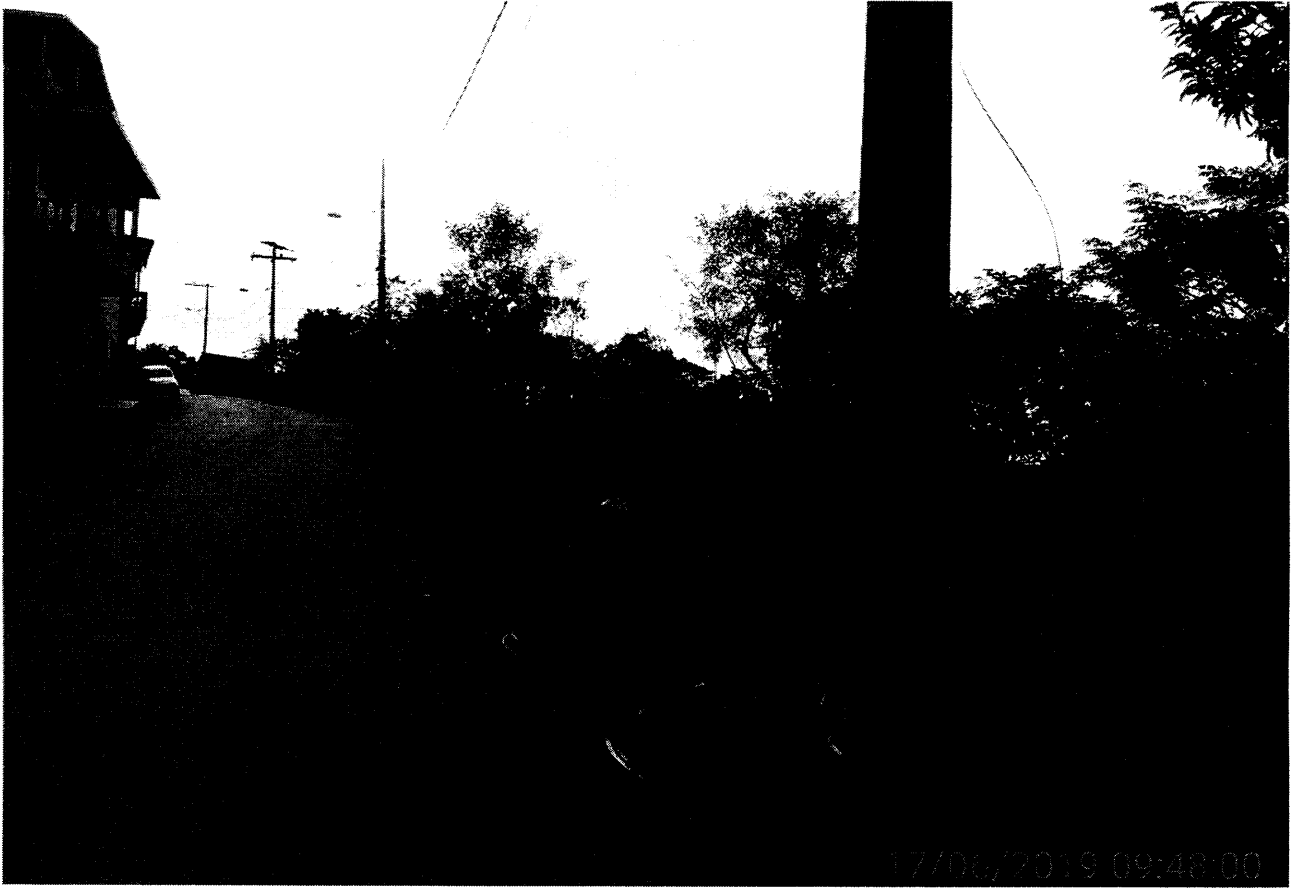
Frente do terreno