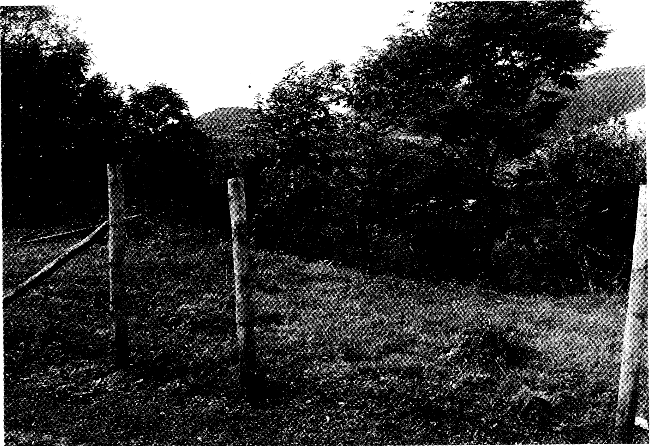
Frente do terreno