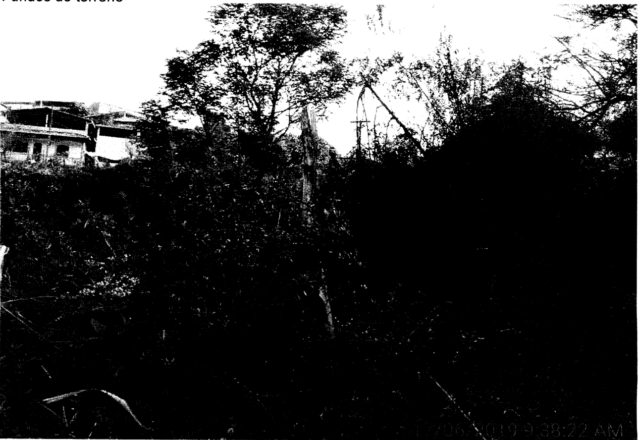
Fundos do terreno