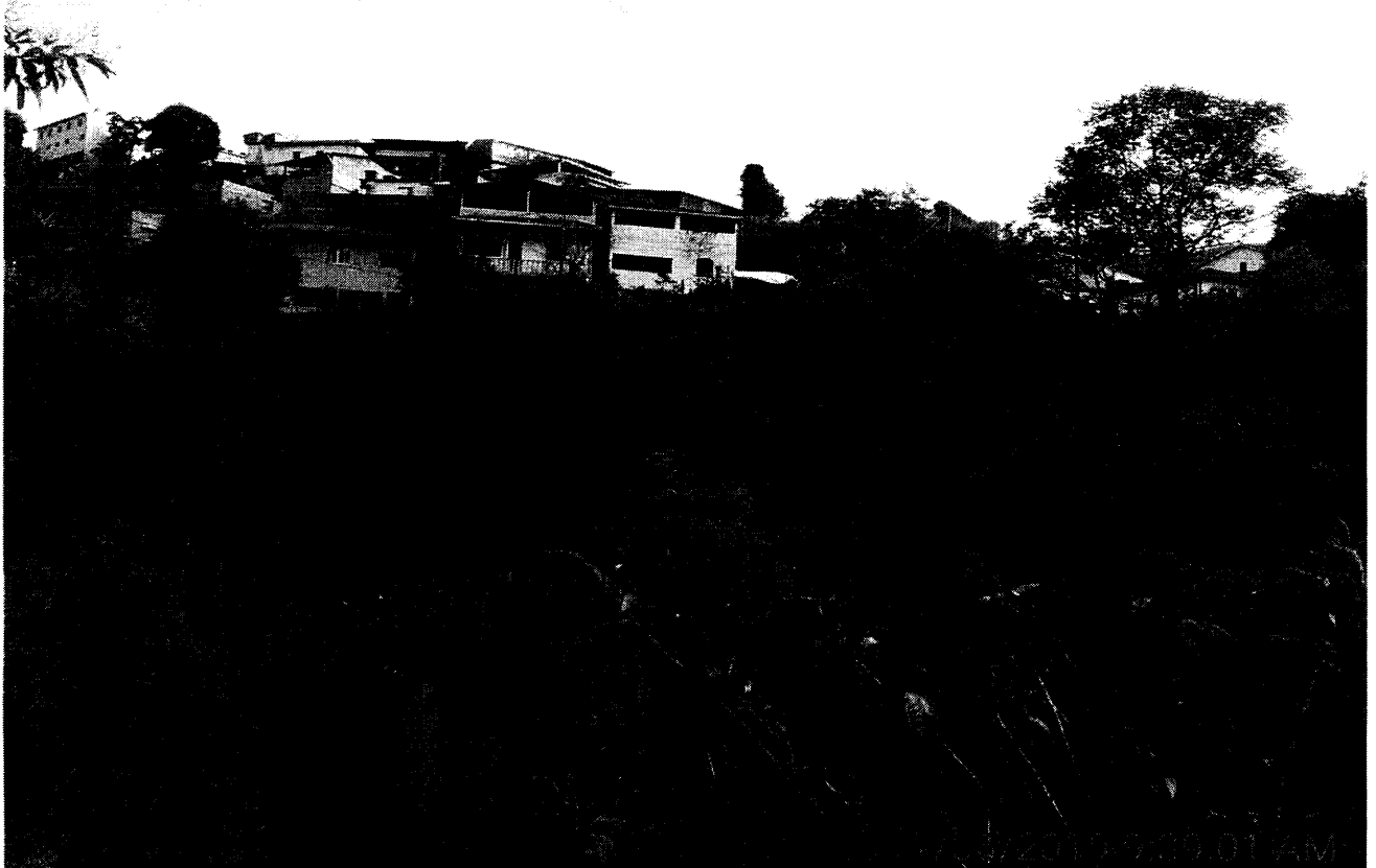
Fundos do terreno