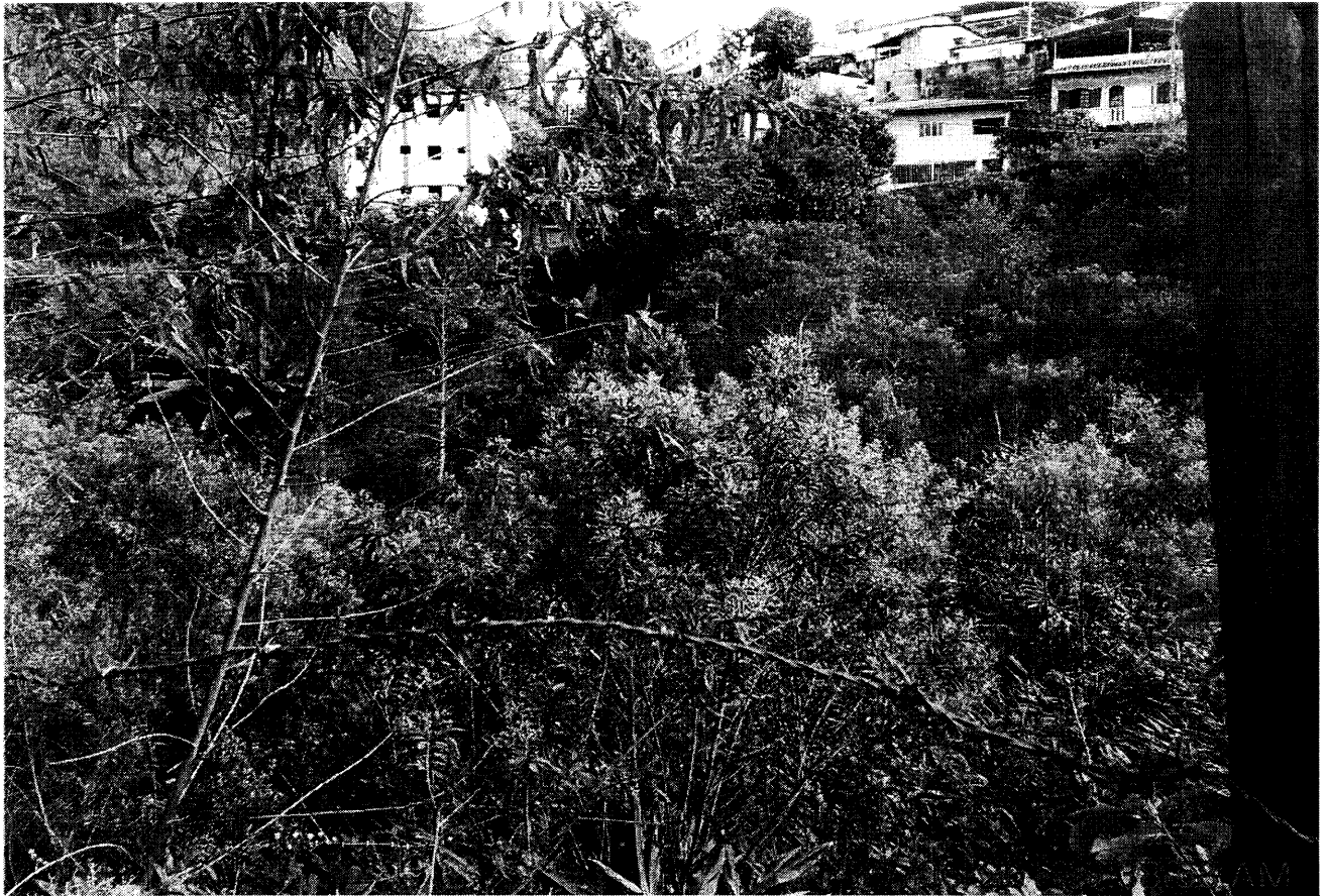
Fundos do terreno