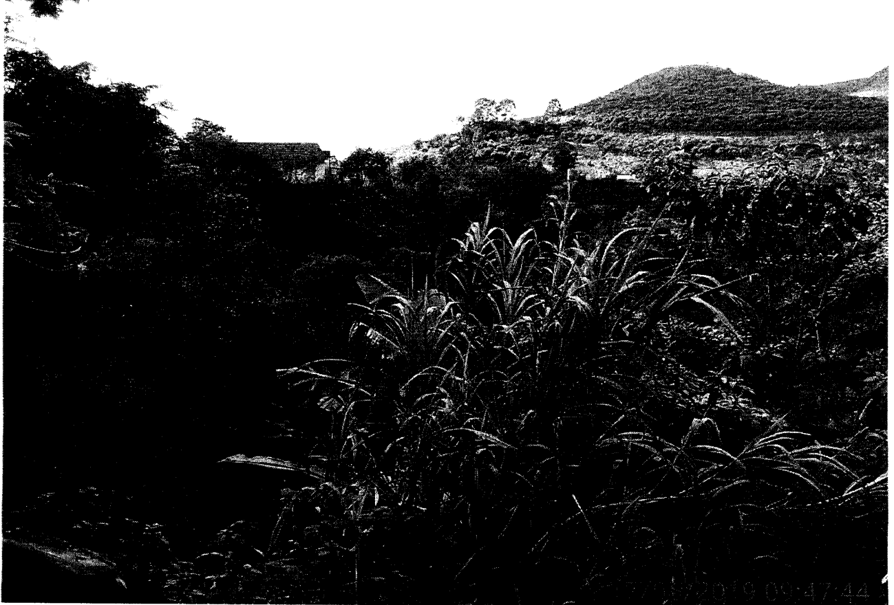
Fundos do terreno